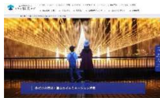
イルミネーション特集（8,877PV）